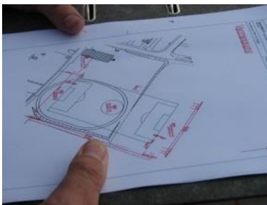
Stavební úřad vysvětluje stavební plány

Sportovci také sami odvedli spoustu práce, například postavili oplocení, reklamní tabule a vykopali výkopy pro kabely.