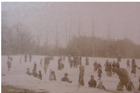
Bruslení na rybníku Gregor

Mezi Birkenbuschem a Jubelallee byl v dolní polovině louky vybudován rybník, který mohla mládež v zimě využívat k bruslení. Tomu se také až do roku 1913 říkalo "Birkenbuschteich". Poté převládl název "Gregorův rybník".