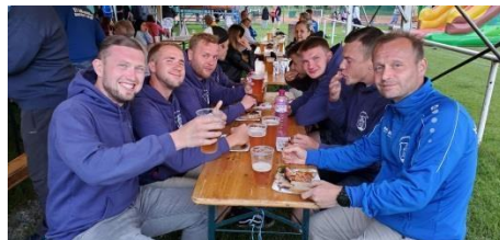
Pivo v Suchdole vždy chutná dobře.