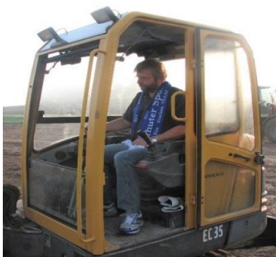
Slavnostní položení základního kamene

Slavnostní zahájení výstavby nového sportovního areálu se uskutečnilo 16. září 2009. Samotná stavba byla zadána firmě Barthel - Sportplatzbau z Großwigu u Torgau.