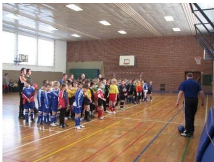
2009 Odměňování vítězů a závěrečná fotografie