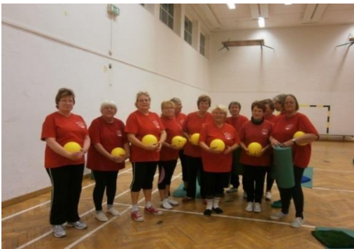
Gymnastická skupina, cca 2015

20 až více než 80 let. Rádi cvičí při hudbě. Cvičební program obohacují různé sportovní pomůcky, ať už strečové gumy, míče, hole, pneumatiky nebo činky. Zpestřením však byla i chůze, turistika, jízda na kole, bowling a plavání.