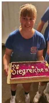
Vítězné dorty tradičně sponzoruje pekárna Paul, zde pro rok 2012 a 2023.

Po mnoho let se na přelomu října a listopadu konaly slavnosti vína , které bohužel musely být z důvodu nedostatečné účasti a značných časových a finančních nákladů zrušeny.