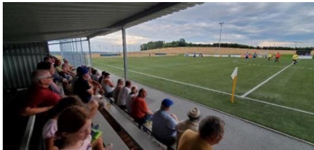
Plošina pro diváky, nyní se zastřešením

S využitím hřiště s umělým povrchem bylo stále více nutné vytvořit společenskou místnost. Protože suterénní místnost bývalého klubu mládeže již nebyla využívána, byla pro sportovní klub jasnou volbou. S městem Herrnhut bylo dohodnuto výhodné využití. Členové klubu odvedli mnoho hodin práce, aby prostor připravili pro naše potřeby, a od té doby se z takzvané "hadice" stala klubovna. Po tréninku a někdy i po zápasech byla klubovna využívána ke společenskému posezení, společnému sledování fotbalových zápasů a také k diskusním skupinám a tréninkovým akcím.