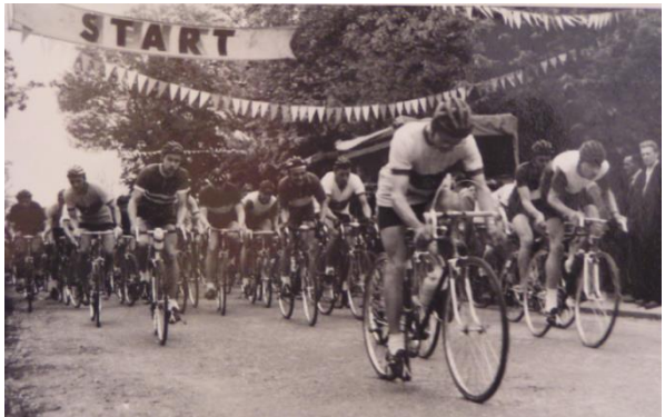
Start a cíl v Rennersdorfer Straße

Cyklistický závod "Kolem Hutbergu" v Herrnhutu pořádala BSG od roku 1955 jako sportovní akci k oslavě 1. května. Zúčastnili se ho účastníci ze všech věkových skupin z Herrnhutu a okolí s cestovními koly na startu. Od roku 1958 se na nové trase konaly také závody pro cyklisty s licenci. Zájem vedoucího cyklistické sekce při okresním zastupitelstvu Löbau vedl k uspořádání této akce.