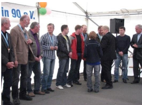
Předání klíčů od nového sportoviště trenérům

Zvláštní uvítání se dostalo také zástupcům mnoha sponzorů, kteří významně přispěli k úspěchu projektu. Patřily mezi ně společnosti Böhme, Dürninger a Mietke Pressegroßhandel. Ale také banka Sparkasse Oberlausitz-Niederschlesien a Volksbank Löbau-Zittau.