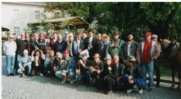
Začátek 25. turné Ascension Tour 1999