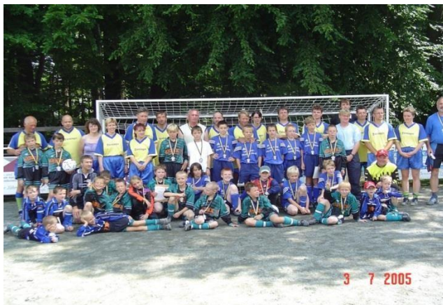
"Rodiče : děti" v rámci letního festivalu 2005

V následujících letech byl klubový život stále rozmanitější. Vedle mužské a seniorské části se rok od roku rozšiřovala i juniorská část. Na tréninky a soutěže muselo dohlížet několik týmů od dětí až po juniory (ve věku od 6 do 18 let). Stávající trenéři odváděli výbornou práci, neboť byli zodpovědní za trénink a obvykle i za zápasový provoz jim přidělených týmů.