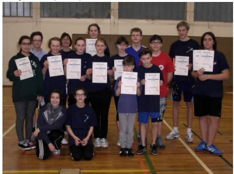
Sportovci po turnaji v Herrhutu 2011