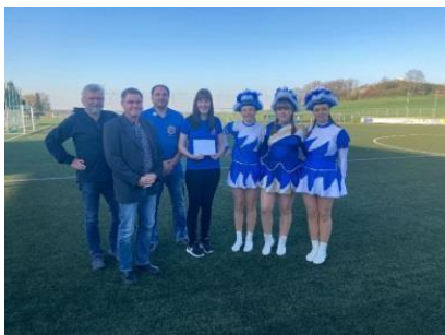
Předání darovacího šeku BKC, 2023

Letní festival byl a je vždy vrcholem roku. I stavění stanu a příprava jednotlivých akcí vyžadovaly dobrou logistiku.