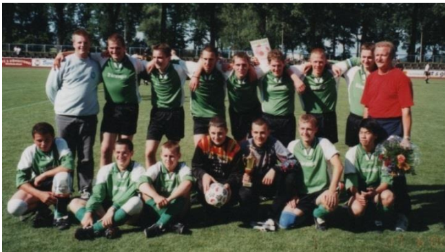
Vítěz poháru 2000, A-junioři,

Herrnhuter Sportverein 90 e. V. se i nadále účastnil různých akcí, jako byl například závod na mýdlech, který se konal několik let na Den Diakonie. Klub však také několikrát uspořádal zábavnou slavnost na lesním koupališti v Herrnhutu.