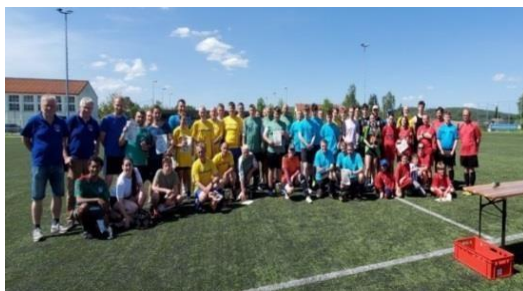
1. května 2018 - Turnaj městských částí města Herrnhut - 1. května 2024