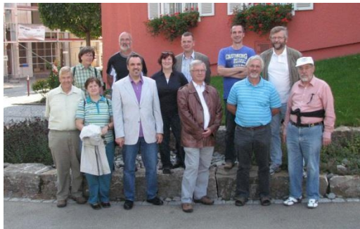
2011: 40 let FC Amtsschimmel, delegace z Herrnhutu na radnici v Bollu

Od roku 1998 se díky návštěvě zastupitelstva města Herrnhut v Suchdole nad Odrou rozvíjejí vztahy mezi sportovci obou měst. Následovaly pravidelné vzájemné návštěvy. Vrcholem byly vždy zápasy seniorů, mužů a juniorů. Po sportovní stránce měli suchdolští přátelé většinou navrch. To však nic neubralo na významu společných oslav a přátelství, které se mezi nimi vytvořilo.