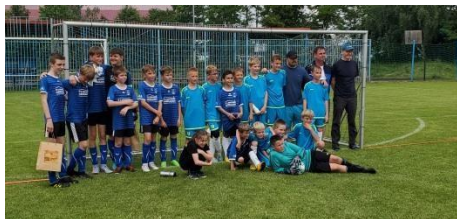
Nachwuchs Suchdol / Herrnhut,