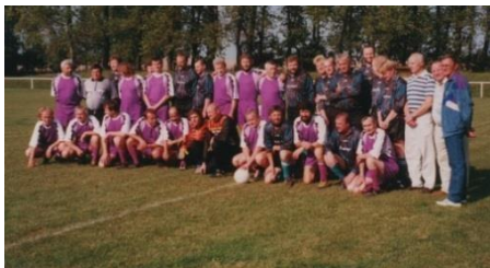
1998 Týmy juniorů a mužů