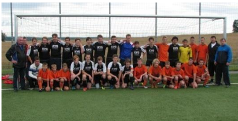
Juniorské týmy v Suchdole 2005 a v Herrnhutu 2012