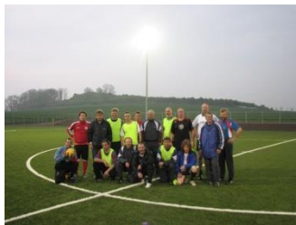
První tréninky na novém hřišti pod světly reflektorů.

Dne 21. května 2010 konečně nadešel čas. Nové hřiště s umělou trávou bylo slavnostně otevřeno ve stanu na kluzišti. Slavnostní projev pronesl prezident HSV 90 e. V. Hans-Michael Wenzel. Pozvání přijala řada čestných hostů. Byli mezi nimi starosta města Willem Riecke, starosta