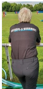
Týmy mužů ze Suchdola a Herrnhutu 2023 s fanouškem