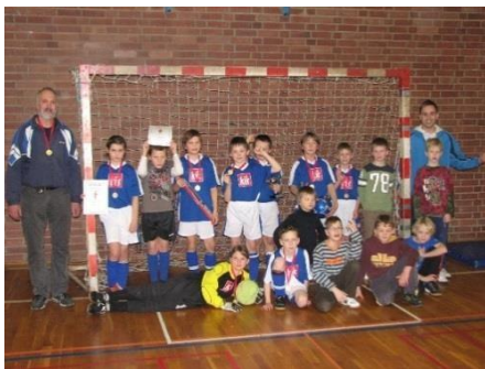
Halový turnaj 2014

Na začátku roku se ve sportovní hale gymnázia konají halové turnaje pro všechny věkové skupiny . Od roku 2005 se turnaj mladších žáků D koná jako "Turnaj Güntera Bauma" na počest Güntera Bauma, dlouholetého přítele sportu.