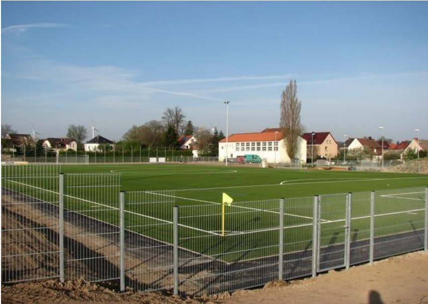
Nové chytré hřiště s umělým trávnikem

Nikdy více tvrdé hřiště - to bylo krédo této akce. Po dalších projevech a slavnostním rautu bylo hřiště slavnostně zahájeno čestným přípitkem osobností.