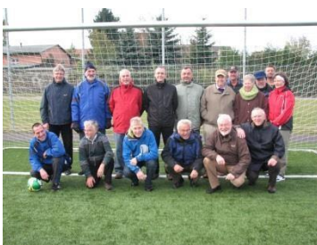
Na turné s "Amtschimmel" v roce 2010 a na našem novém hřišti